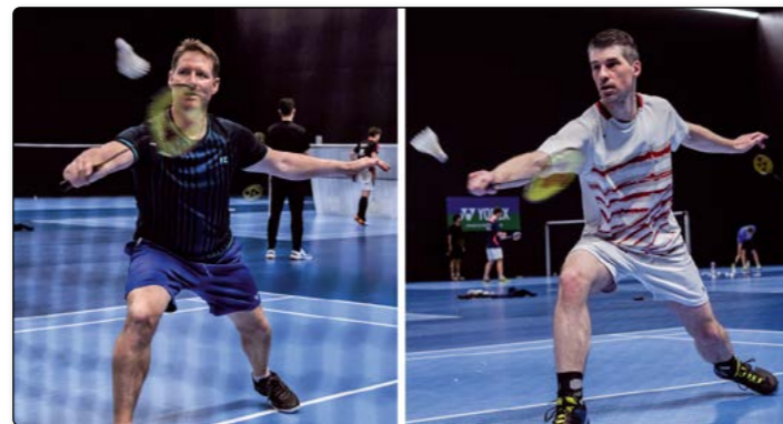
Spieler der MTG beim Training