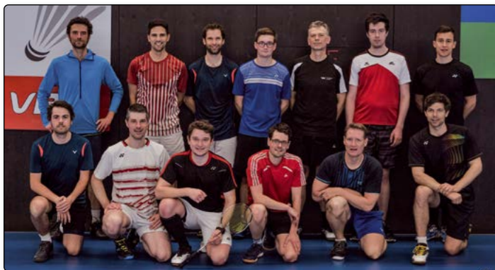
Teilnehmer und Coaches des Trainings-Workshops in Dornbirn